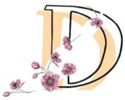
Figure di donne sante